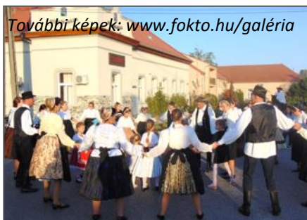
További képek: www.fokto.hu/galeria